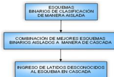
Figura 2. Esquema de clasificación en cascada.

cada clase de interés, cada clasificador fue entrenado para que tuviera la capacidad de identificar òlo que esò el latido y òlo que no esò. Cuando se habla de de òlo que esò se contempla en la òclase de interésò y cuando se habla de òlo que no esò, se contempla dentro de la clase òOtrosò, como se muestra en la Figura 3.