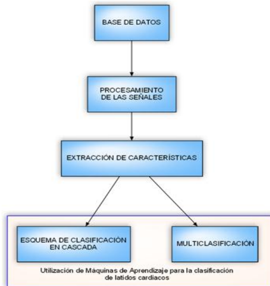
Figura 1. Metodología utilizada.

En la Figura 1 se describe el esquema propuesto para tratar los registros ECG disponibles, desde el momento en que son obtenidos de la base de datos hasta la evaluación de los sistemas de aprendizaje, a continuación se describen las consideraciones de cada uno de los bloques presentes en la figura ya mencionada.