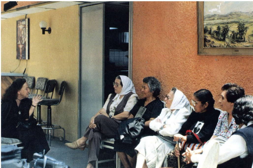
Figura 2. Encuentro entre Rosario Ibarra de Piedra y las Madres de Plaza de Mayo de Argentina