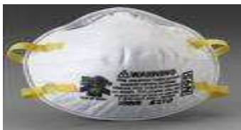
Figura 3. Tapabocas o mascarilla.