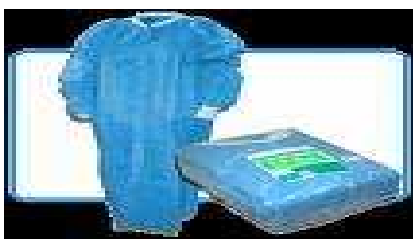
Figura 4. Bata de Bioseguridad.

3.3.4 Jabón antiséptico. El jabón antiséptico se utiliza para el lavado de manos antes y después de cada procedimiento de calibración, evitando de esta manera la presencia de enfermedades entrecruzadas.