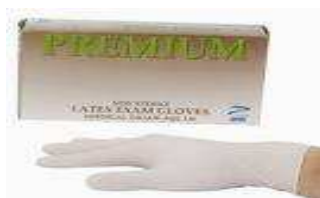
Figura 2. Guantes.