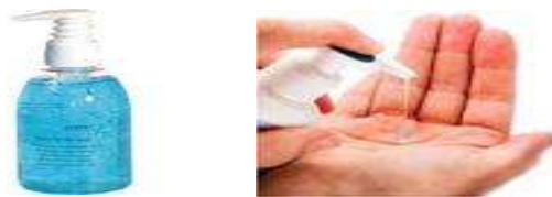
Figura 5. Jabón antiséptico.

3.3.4 Jabón antiséptico. El jabón antiséptico se utiliza para el lavado de manos antes y después de cada procedimiento de calibración, evitando de esta manera la presencia de enfermedades entrecruzadas.