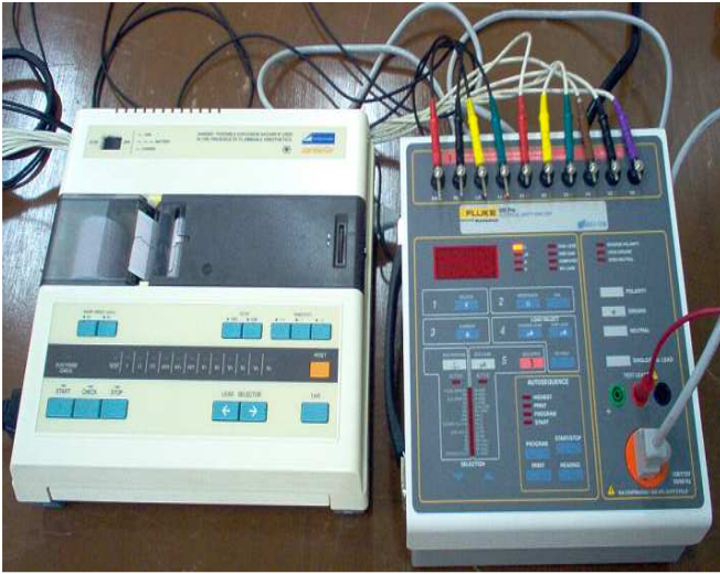
Figura 3. Conexiones entre el equipo ECG y el analizador 505 PRO