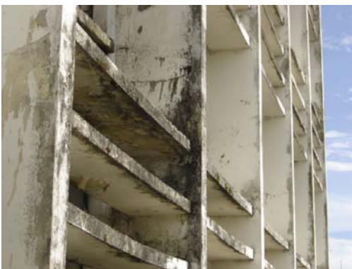
Figura 4. Estado actual de la edificación.