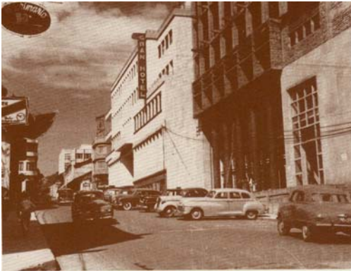
Figura 3. Antiguo Palacio Nacional, Pereira.