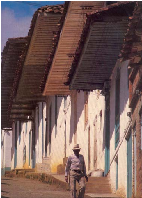
Figura 2. Sistema de aleros tradicionales