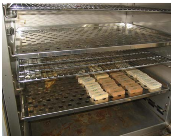
Figura 3. Proceso de secado de muestras