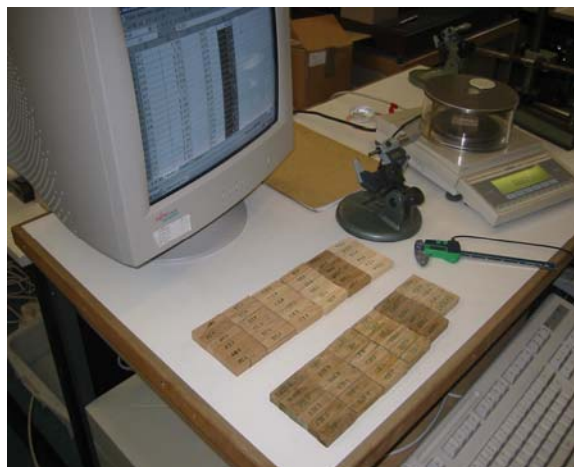
Figura 1. Proceso de pesado inicial de muestras

Se emplearon 4 recipientes de vidrio de aprox. 40 cm (L) x 30 cm (b) X 30 cm (h) cerrados en la parte superior y con agitación mecánica lenta para el movimiento del aire en el ambiente, donde se depositó la solución y se colocaron las muestras sobre una parrilla acerada. La medición de la humedad se hizo en dos formas, medición eléctrica y medición gravimétrica; la medición eléctrica se efectuó con equipo medidor de humedad marca GANN. Se empleo balanza marca Sartorius LP3200D con 0,001 g. de precisión.