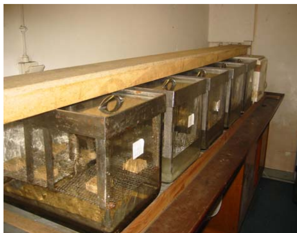
Figura 2. Proceso de acondicionamiento y Climatización de muestras