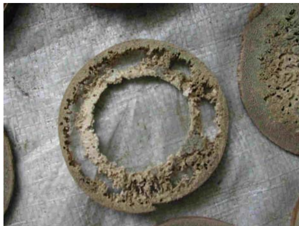
Figura 1. Ataque Biótico, destrucción total de la Guadua, por insectos xilófagos, como el Dinoderus minutus y otras especies.

vulnerable al ataque de Factores Bióticos y Abióticos; entre los factores Bióticos tenemos el ataque de insectos xilófagos con especies como ( Dinoderus Minutus , Eucalandra Setulosus , Gnathocerus Cornutus , Tribolium Castaneum y Catolethrus Fallax ) [5][8] (ver Foto 1) y hongos que no se estudiaron en esta investigación. Los Factores Abióticos como las condiciones ambientales (Atmosféricas), la presencia de grietas, rajaduras y daños por mal secado (ver Figura 1) y la vulnerabilidad al Fuego.