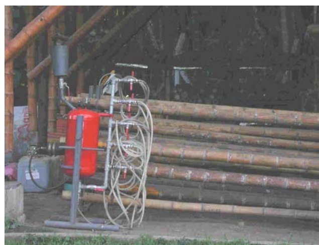
Foto 1. Equipo Prototipo, Método de desplazamiento de savia. (Montoya J. A., 2002), Laboratorio experimental del Proyecto Investigación Tecnológica en Métodos de preservación de la Guadua[5], vivero de la UTP.