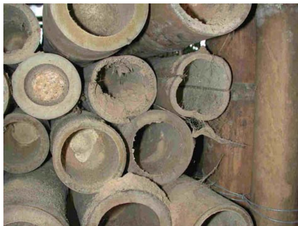
Figura 2. Ataque biótico (Insectos) y ataque Abiótico (rajada), destrucción total de la Guadua, por insectos xilófagos, como el Dinoderus minutus y otras especies.

El equipo prototipo consta de un recipiente o tanque que contiene la solución preservante y un sistema de presión (compresor) que ayuda a vencer la resistencia de la savia de la guadua al paso del líquido preservante, trabajando con una presión de 137.88 KPa (1,36 bares ó 20 psi) para desplazar la savia de la guadua por una solución de ácido bórico y bórax al 3%[1]. El proceso termina una vez la solución preservante ha desplazado la savia de la guadua y ha pasado en su totalidad al otro lado.