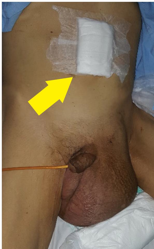
Fig. 2. Nótese hernia inguino-escrotal con pérdida de domicilio. Flecha amarilla señala sitio donde se realiza neumoperitoneo.