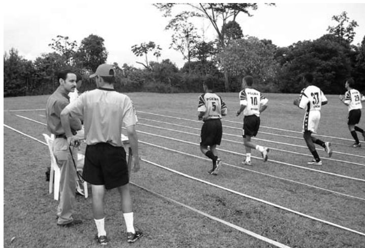
Figura 4. Demarcación de carriles para test de campo