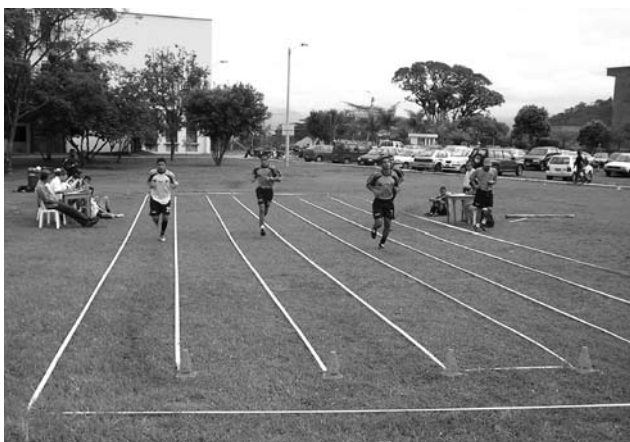
Figura 1. Procedimiento prueba Course Navette.

Los futbolistas deben desplazarse corriendo de una línea a otra separada veinte metros, al ritmo que marca una grabación magnetofónica (figura 2). Este ritmo de carrera aumentará cada minuto. Los futbolistas comienzan la prueba a una velocidad de 8 kilómetros por hora (tabla 1), el primer minuto aumenta a 8.5 kilómetros por hora y, a partir de aquí, cada minuto aumenta el ritmo medio kilómetro por hora. La prueba finaliza cuando no pueden seguir el ritmo marcado (no pisan la línea en 3 ocasiones seguidas).