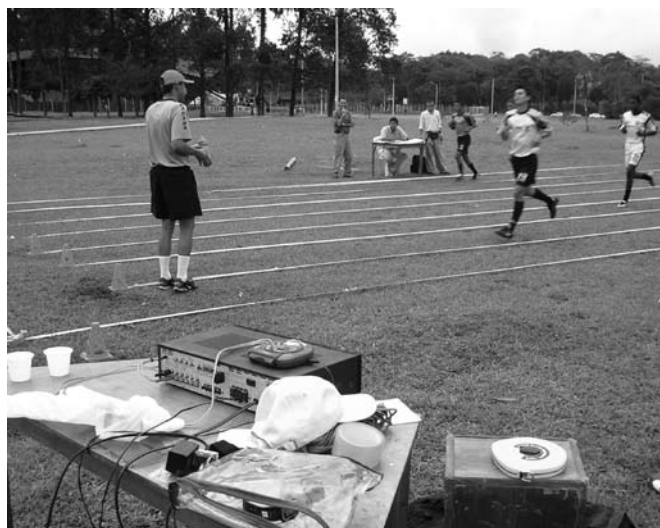
Figura 2. Equipo requerido en el test de Course Navette.

Se toma la máxima velocidad a la que ha conseguido desplazarse antes de terminar la prueba (periodo terminado) y se introduce este valor en una fórmula que calcula el VO_2 máximo (2). Por tanto, se trata de un test máximo y progresivo. Esta prueba mide la potencia aeróbica máxima e indirectamente el consumo máximo de oxígeno ( VO_2 máximo). El consumo máximo de oxígeno es la máxima cantidad de oxígeno que pueden absorber las células; se expresa en litros por minuto (L/min) o en mililitros por kilogramo por minuto (ml/Kg/min).